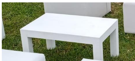
MESA DE CENTRO MN$650.00