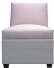
SILLÓN INDIVIDUAL LOUNG MN$850.00