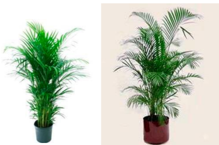
Plantas Arekas (1mt de alto aprox) MN$750.00