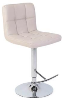
BANCO ALTO 1 MN$650.00