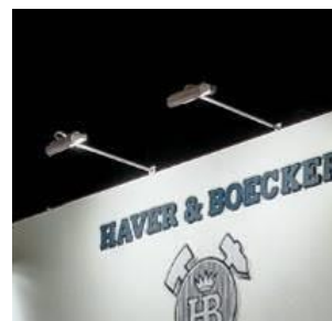
Lámpara de brazo MN$400.00