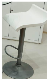
BANCO ALTO 2 MN$450.00