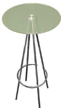
MESA ALTA 1 MN$1,600.00