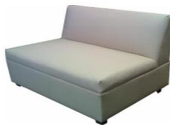
SILLÓN DOBLE LOUNGE MN$1600.00