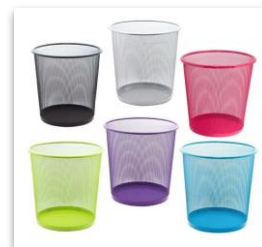
Cesto para basura MN$350.00