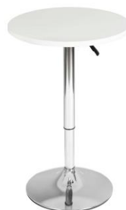
MESA ALTA 2 MN$1,200.00