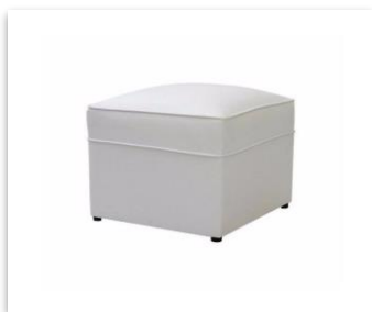
TABURETE LOUNGE MN$550.00